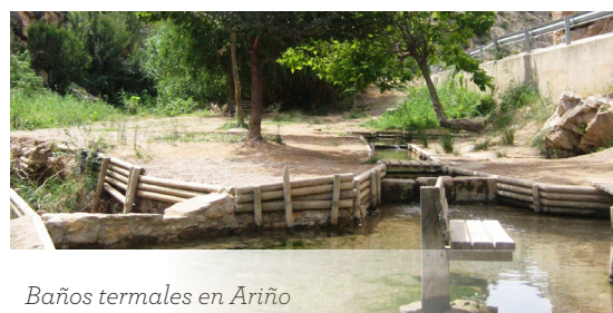
Baños termales en Ariño