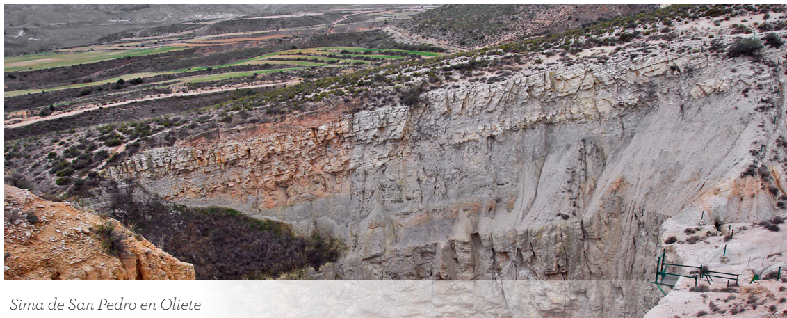
Sima de San Pedro en Oliete

La salida “Explosión de Paisajes” proporciona a los escolares una experiencia divertida y diferente fuera del aula . Les ayuda a reforzar conceptos y procesos geológicos en entornos naturales únicos aragoneses, como son los Lugares de Interés Geológico de Aragón (LIGs).