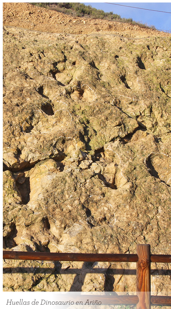
Huellas de Dinosaurio en Ariño

Comida (no incluida), breve explicación de las aguas termales y despedida.