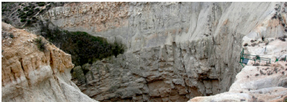
Sima de San Pedro en Oliete, Teruel.

** Se recomienda llevar vestimenta adecuada para la actividad de trekking: botas cómodas o deportivas, gorra, protector solar, chubasquero y agua. ¡no olvides la cámara de fotos!