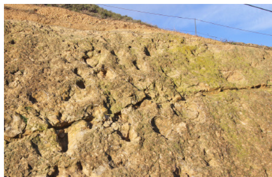
Yacimiento de huellas de dinosaurio de Ariño, Teruel.