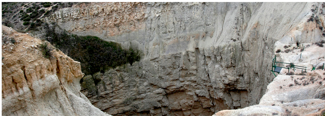
Sima de San Pedro en Oliete, Teruel.

** Se recomienda llevar vestimenta adecuada para la actividad de trekking: botas cómodas o deportivas, gorra, protector solar, chubasquero y agua. ¡no olvides la cámara de fotos!